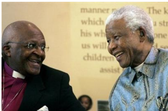
Nobelprisijswinnaars Nelson Mandela en Desmond Tutu leefden in dezelfde straat in Soweto.